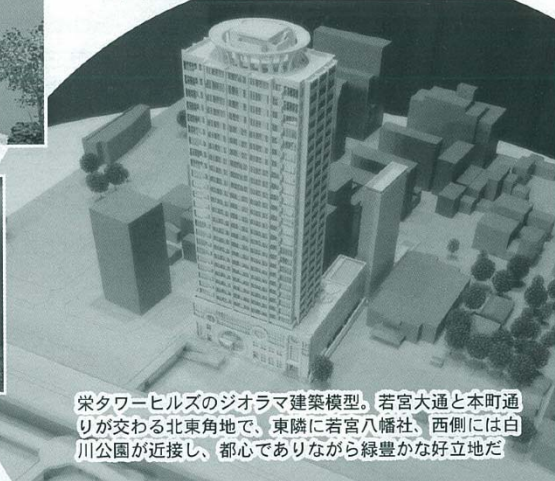
栄タワーヒルズのジオラマ建築模型。若宮大通と本町通りが交わる北東角地で、東隣に若宮八幡社、西側には白川公園が近接し、都心でありながら緑豊かな好立地だ