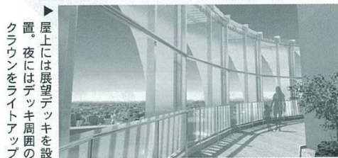
▲屋上には展望デッキを設置。夜にはデッキ周囲のクラウンをライトアップ