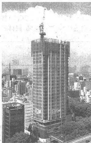
名古屋市の中心部で分譲ではなく、賃貸の高級マンションを建設する（写真上）。内外装に質の高い建材を使い、高級感を持たせる（同下）